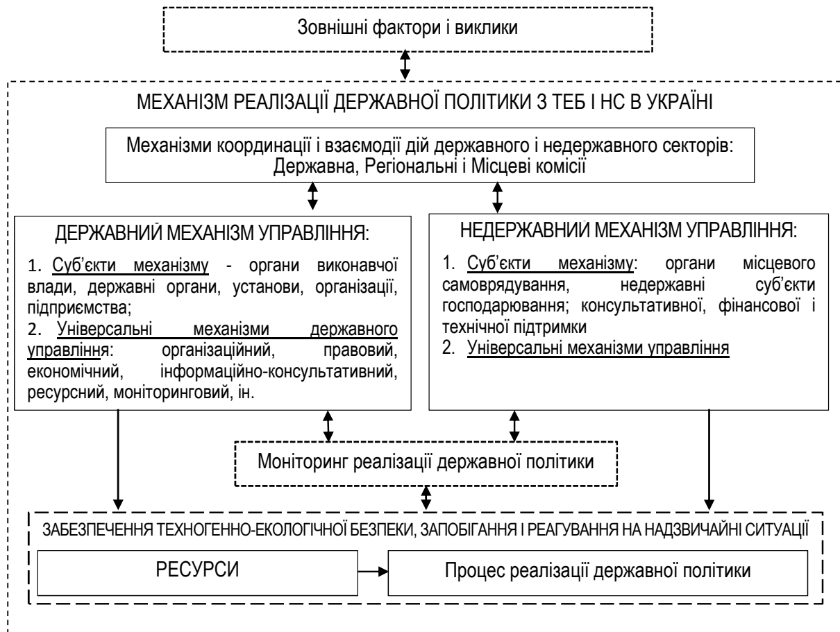
Рис. 2. Складові механізму реалізації Державної політики з ТЕБ та НС.

Ці механізми є інтегрованою структурою, яка є відкритою соціальною системою (організацією). Її побудова утворена логікою специфічних відносин її елементів, заснованих на наступних принципах: